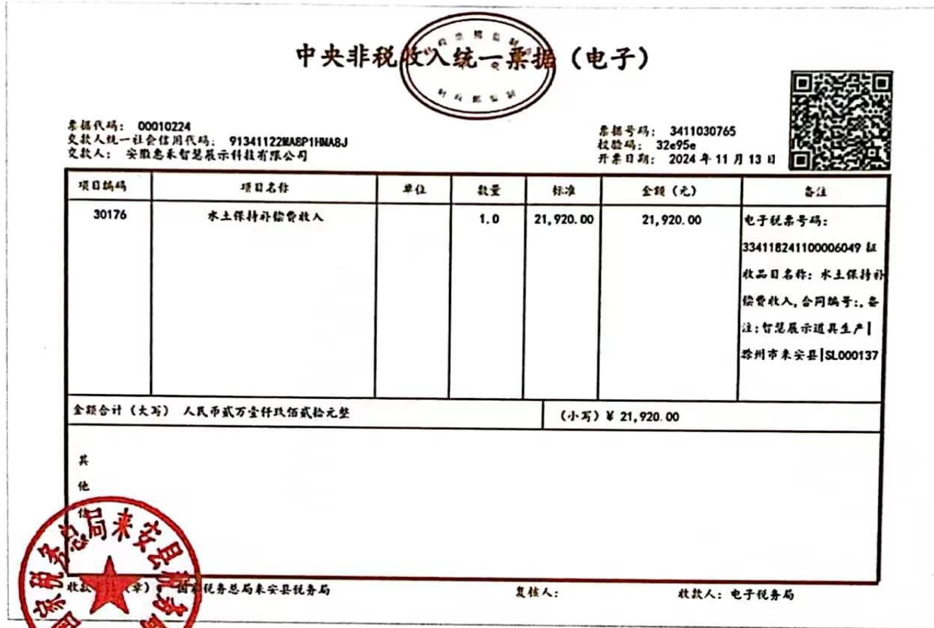
附表 2：项目水土保持补偿费缴款凭证